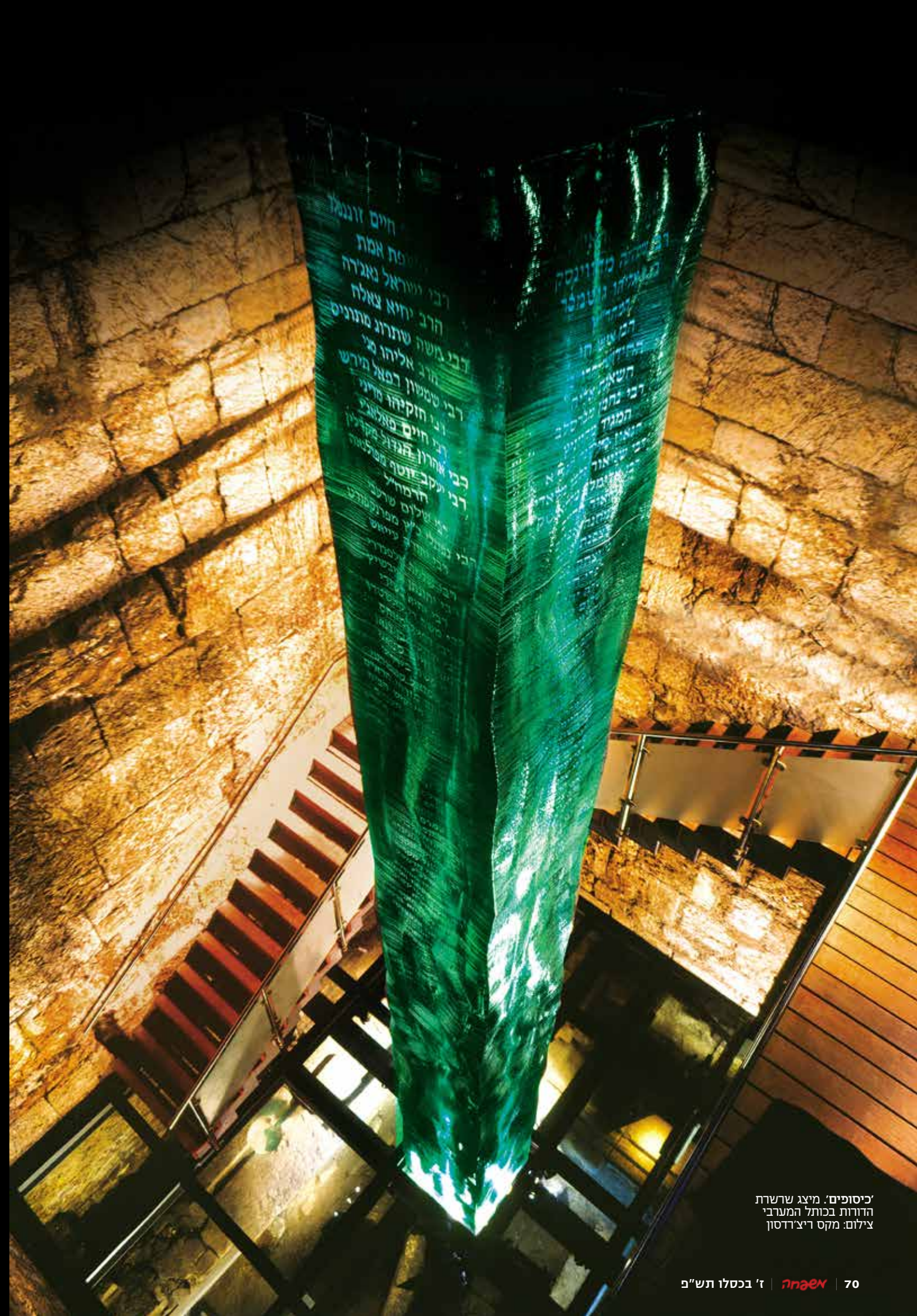
'כיסופים': מיצג שרשרת הדורות בכותל המערבי