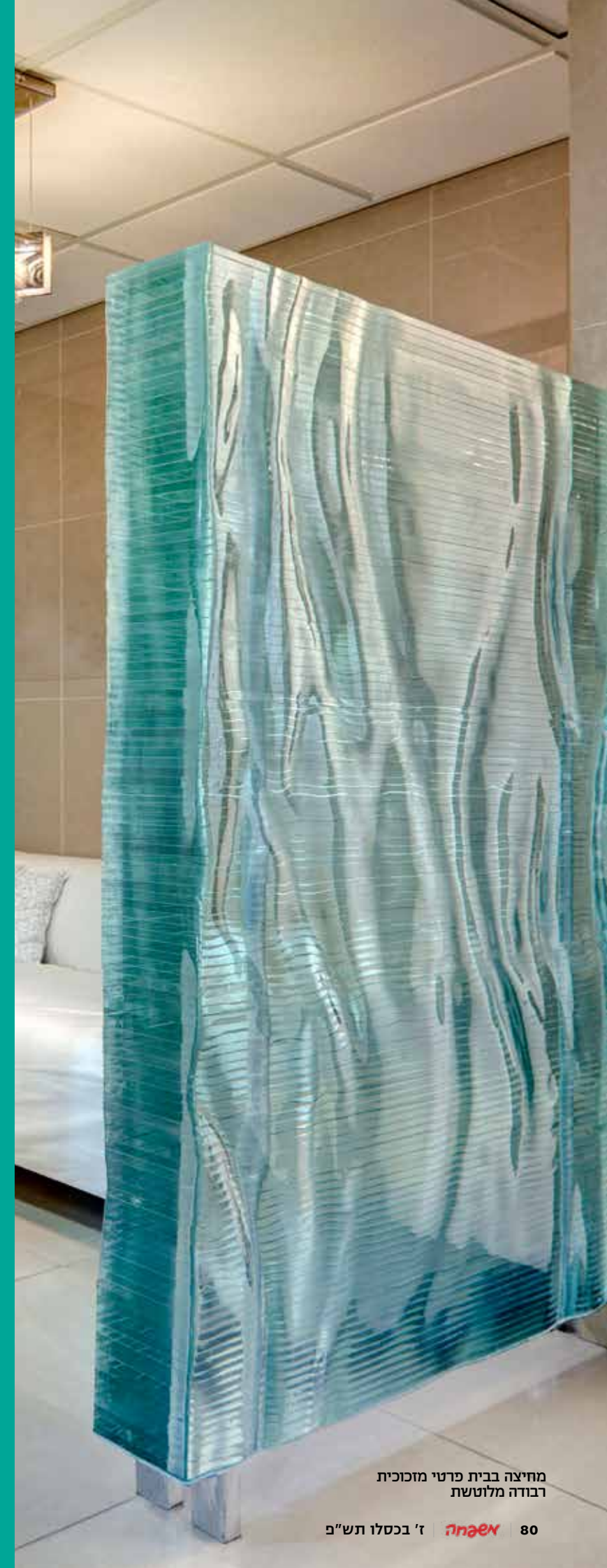
מחיצה בבית פרטי מזכוכית רבודה מלוטשת