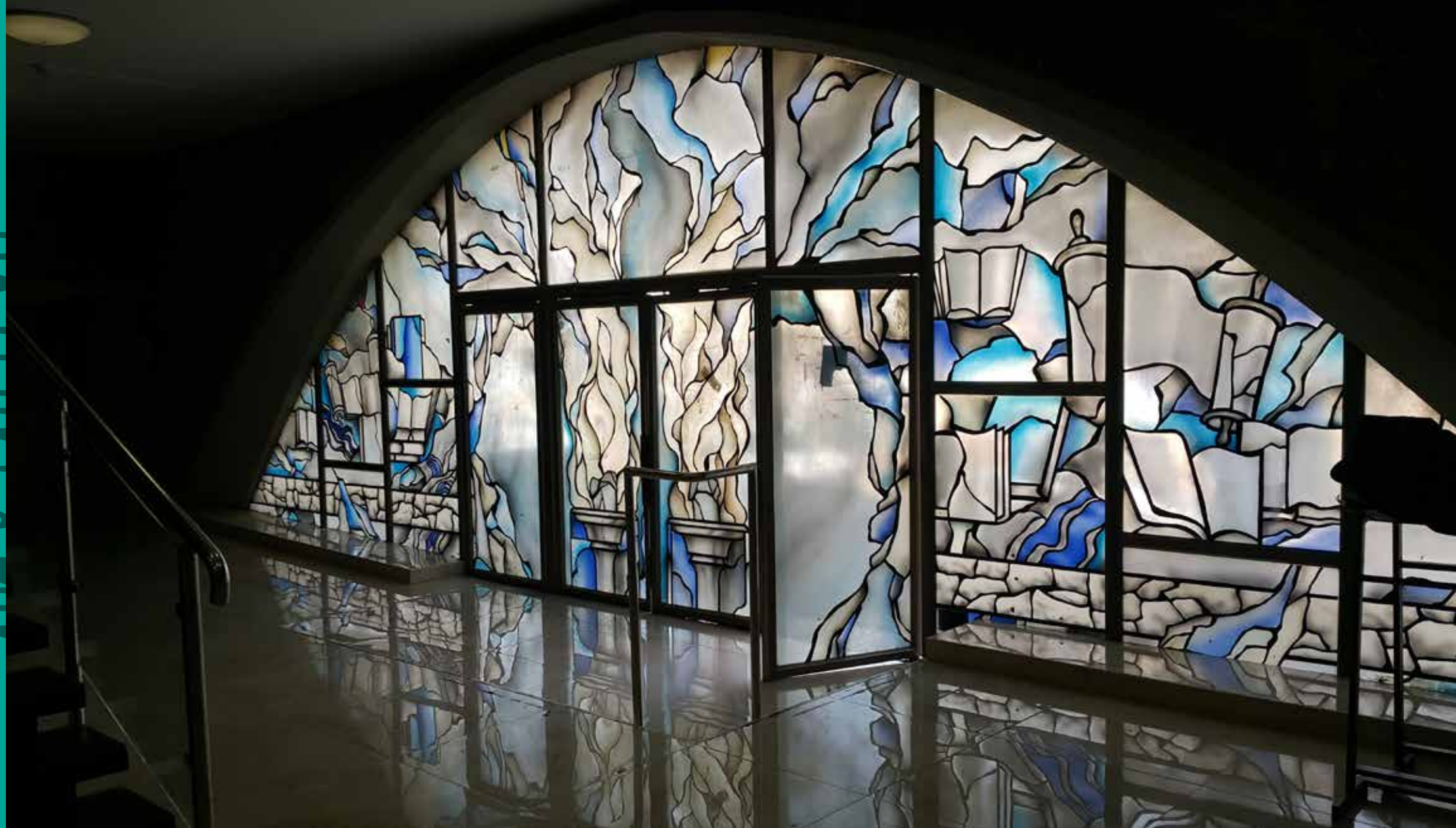
אוהל קדושים, פוניבז', בני ברק

כאמור, לאחרונה ממש יצר לנגפורד את קיר המזרח המפואר של היכל הקדושים. "שאר הקירות כעת הם קירות בטון, ואני מחכה להזדמנות שייתנו לי להשלים את המלאכה. בינתיים, מחוסר תקציב, אנחנו לא מתקדמים, אבל אם משהו ירים את הכפפה – זה בעזרת השם יקרה".