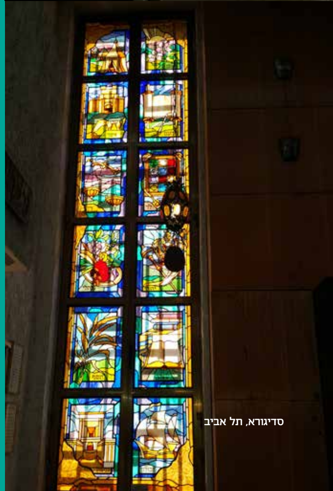
סדיגורא, תל אביב