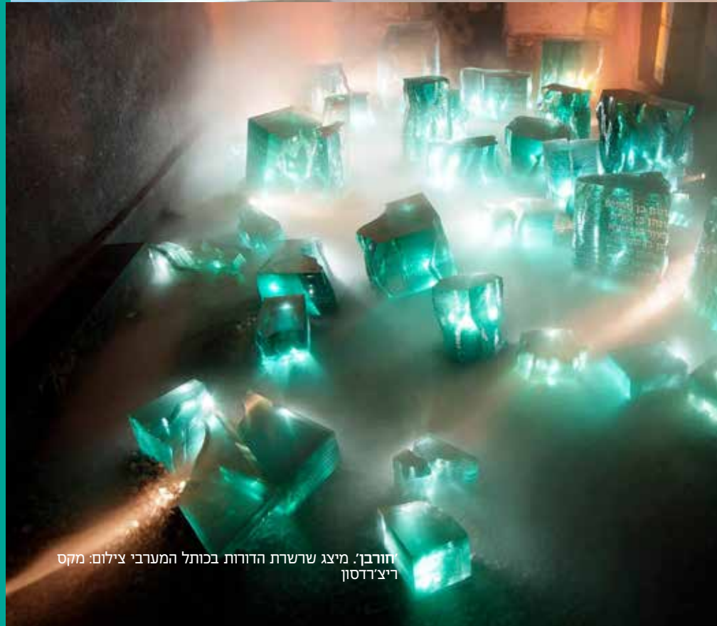
חורבן. מיצג שרשרת הדורות בכותל המערבי