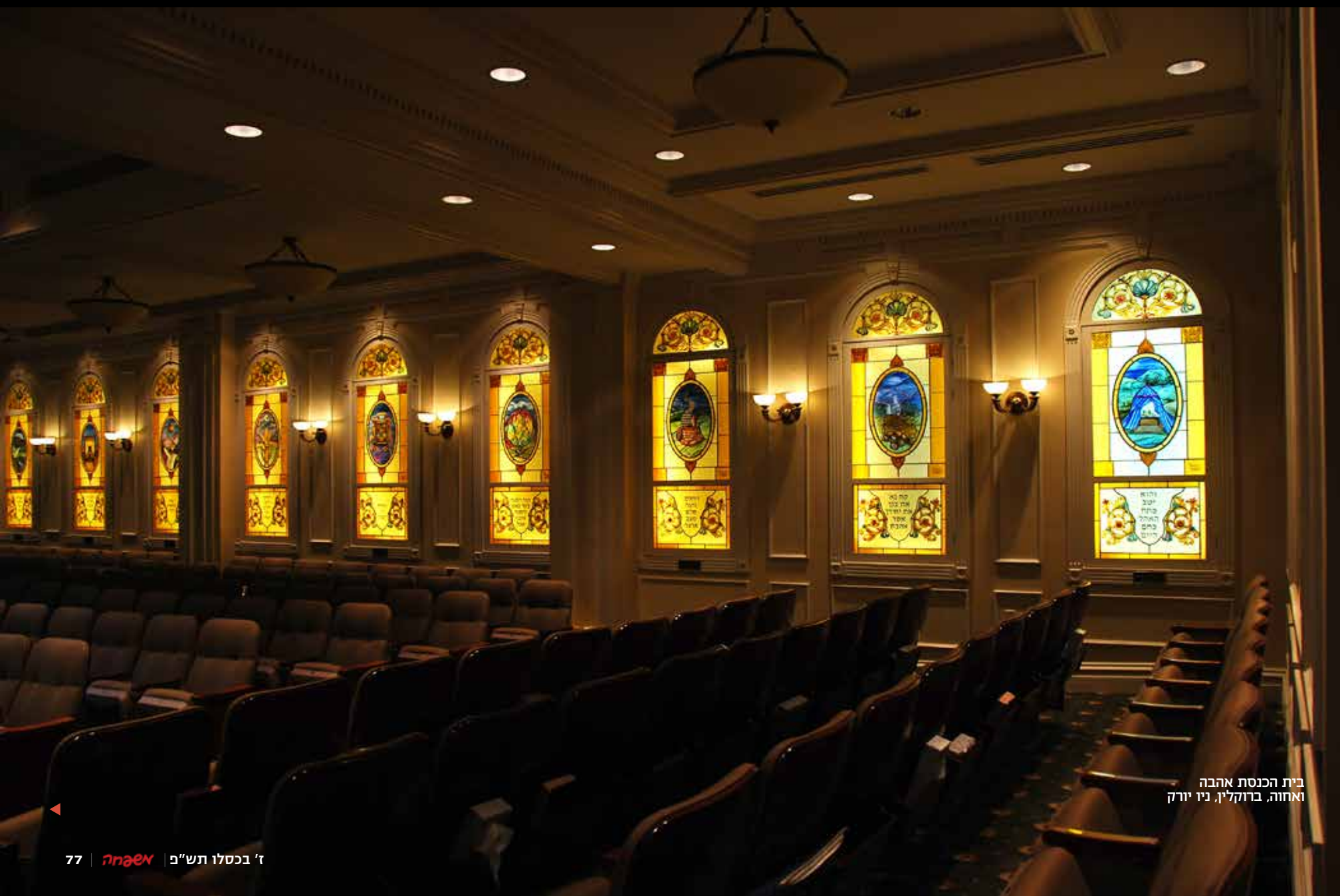
בית הכנסת אהבה ואחוה, ברוקלין, ניו יורק