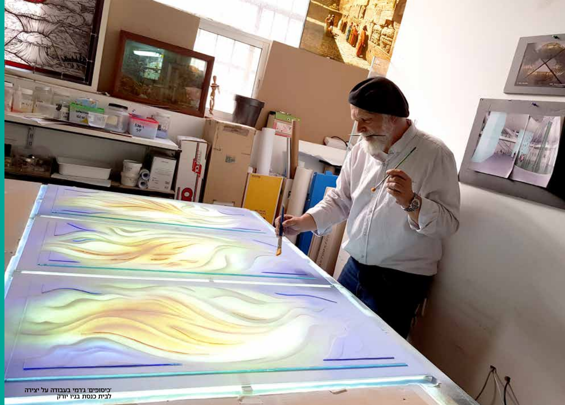
כיסופים' גרמי בעבודה על יצירה לבית כנסת בניו יורק

”זה לא קל”, הוא אומר בעודו מציג בפנינו את התמונות המרהיבות, ”אבל ברגע שאני מקבל את ההארה ומבין מה עלי לעשות, אני מרגיש בבת אחת את משב הרוח ואת הרצון ליצור. באותו רגע אני מסתער על היצירה, ולפעמים עובד בלי הפסקה במשך חודשים ארוכים, עד לרגע שאני יכול סוף סוף לברך על המוגמר”.