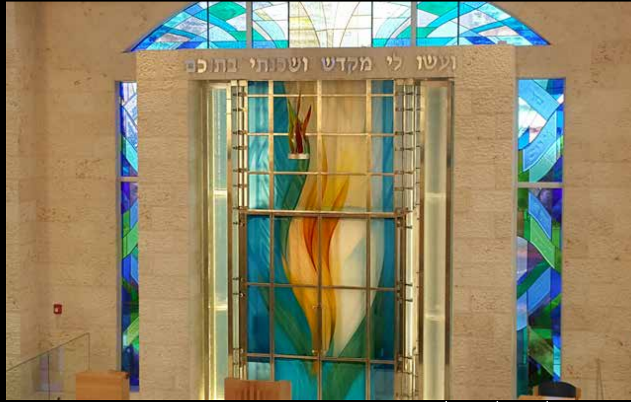
בית הכנסת ישראל הצעיר 'בל הרבור', פלורידה