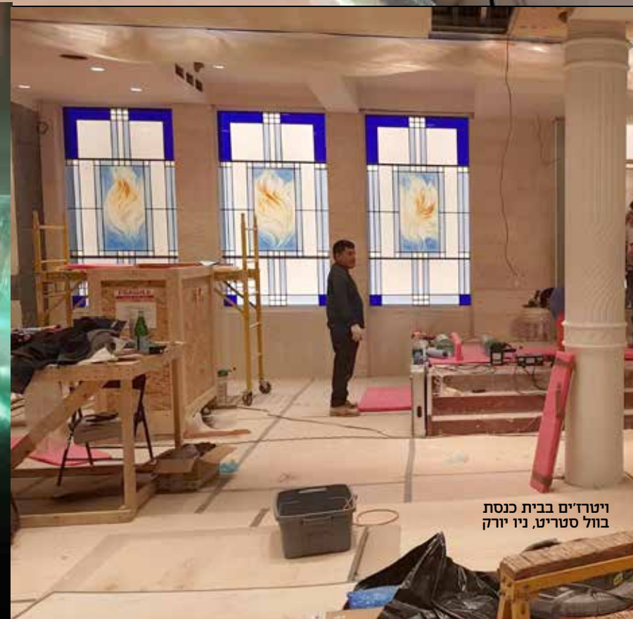
ויטוריום בבית כנסת בוחל סטריט, ניו יורק