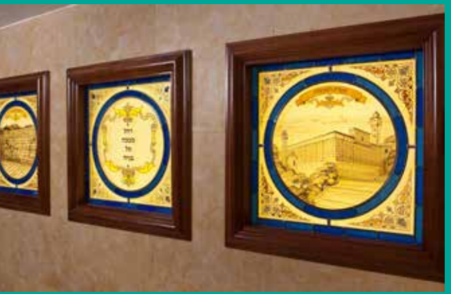
ויטראז'ים בקבר רחל.

בסיפור: "לפני שנים ביקרתי בהצגה שבה הציגו את סיפורי רבי נחמן. החלק הראשון היה מאוד מעניין, כאשר סיפרו את הסיפורים, אבל החלק השני הרס הכל, כי בחלק זה הסבירו השחקנים מה ראינו בחלק הראשון. אני מאוד לא מתחבר להסברים. מבחינתי, אם יש צורך להסביר, זו לא אמנות.