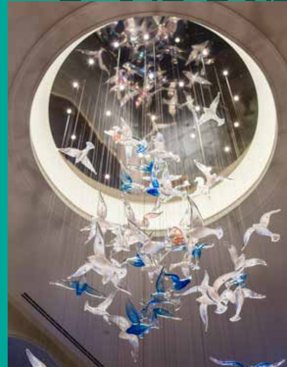
נברשת זכוכית ניפוח